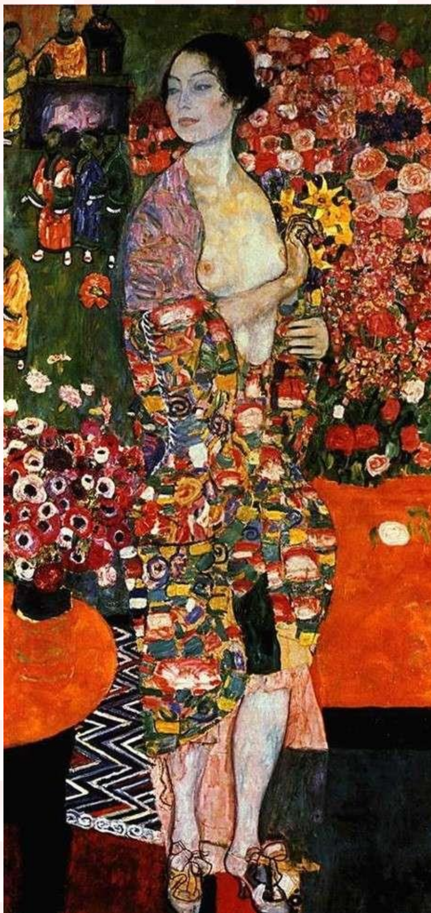
Realizzazione grafica: Ornella Sacco