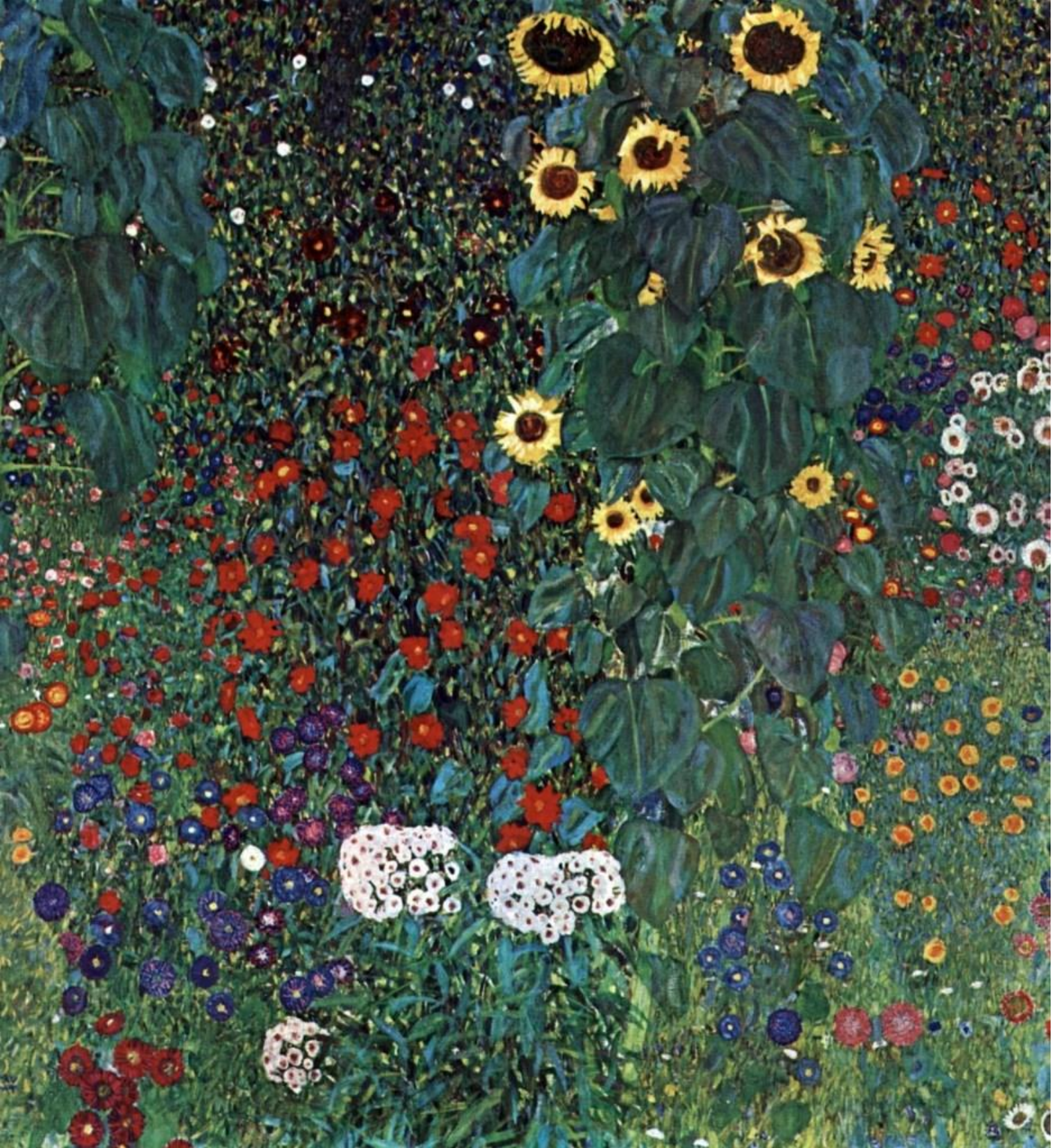
"Giardino di campagna con girasoli" (Gustav Klimt 1905-1906)