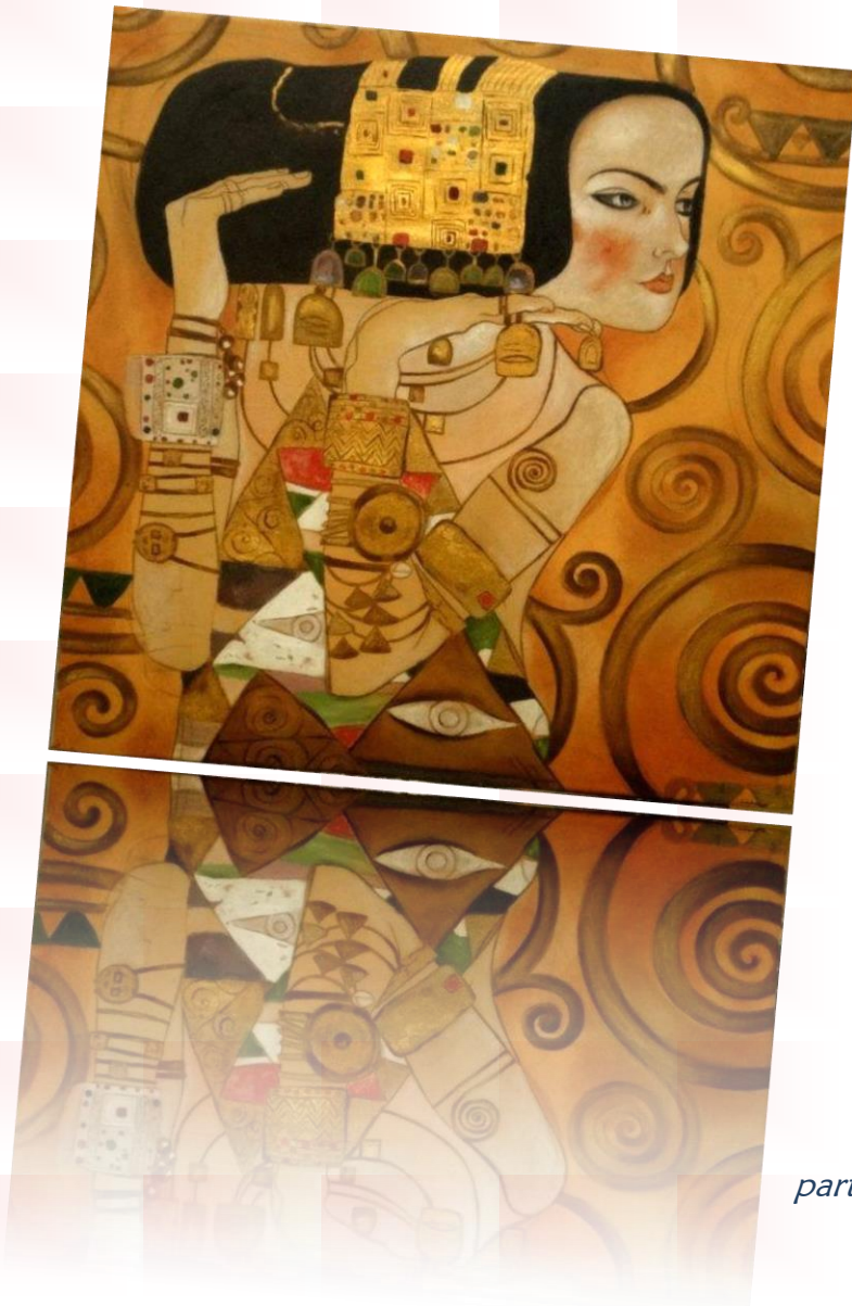
particolare "L'attesa" (Gustav Klimt 1905-1909)

(Castellammare di Stabia - Napoli) IBAN: IT 85 5010 1022 1011 0000 0009 991